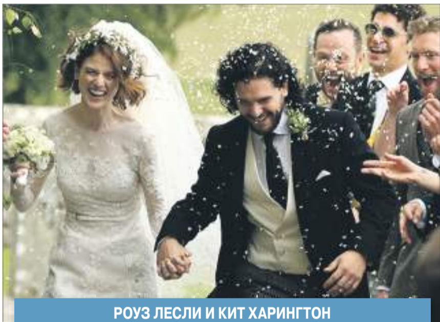
РОУЗ ЛЕСЛИ И КИТ ХАРИНГТОН

ГОЛЛИВУДСКИЕ РОМАНЫ ЧАСТО СТАНОВЯТСЯ ПРЕДМЕТОМ ОБСУЖДЕНИЯ. ЗВЕЗДНЫЕ ПАРЫ СКЛАДЫВАЮТСЯ ИНОГДА СОВЕРШЕННО НЕОЖИДАННО. СУДЬБА ЭТО ИЛИ УДАЧНОЕ СТЕЧЕНИЕ ОБСТОЯТЕЛЬСТВ — РЕШАЙТЕ САМИ