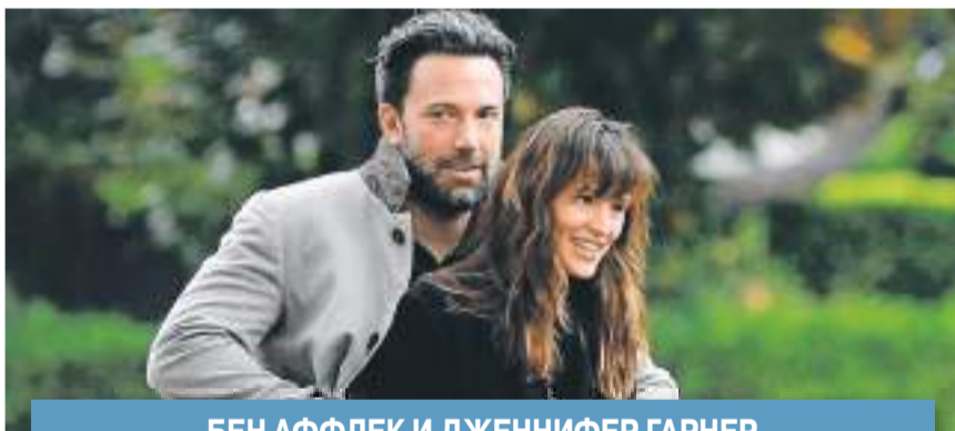
БЕН АФФЛЕК И ДЖЕННИФЕР ГАРНЕР

Сериал «Игра престолов» не оставил равнодушным ни одного зрителя земли. За историей, которая стала культовой, поклонники наблюдали не смывая глаз. Но взволновал их не только сюжет — неожиданно Джон Сноу влюбился в «одичалую». И произошло это в реальной жизни тоже. Кит Харрингтон сделал предложение Роуз Лесли, и недавно актеры сыграли свадьбу.