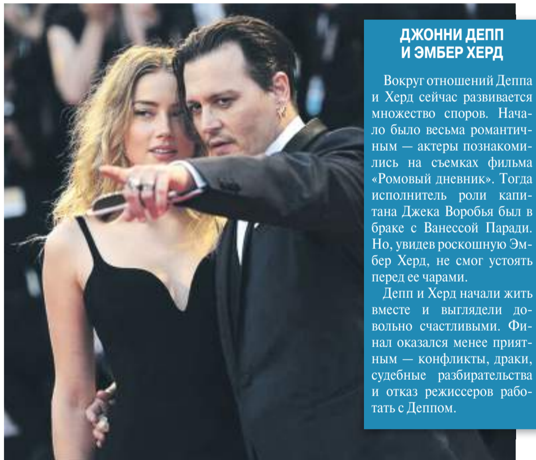
ДЖОННИ ДЕПП И ЭМБЕР ХЕРД

Одна из самых ярких пар Голливуда многие годы радовала поклонников. Джоли и Питт познакомились на съемках фильма «Мистер и миссис Смит». Роковая красотка вскружила голову актеру, и он не смог устоять. На тот момент Питт встречался с Дженнифер Энистон, но сделал выбор в пользу Джоли. Не так давно многолетний союз рухнул, и всё, что связывает бывших супругов, — адвокаты и судебные тяжбы.