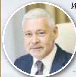
Игорь ТЕРЕХОВ , исполняющий обязанности Харьковского городского головы; школа № 36, выпуск 1983 г.

СЛУШАТЬ ВЗРОСЛЫХ, КАК ПРАВИЛО, НЕ ХОЧЕТСЯ. ОСОБЕННО, КОГДА ТЫ САМ УЖЕ ВЗРОСЛЫЙ. НО СЕГОДНЯ, В ДЕНЬ ВЫПУСКНЫХ ВЕЧЕРОВ, «ХАРЬКОВСКИЕ ИЗВЕСТИЯ» РЕШИЛИ ДАТЬ СЛОВО ЛЮДЯМ, КОТОРЫЕ ПЛОХОГО НЕ ПОСОВЕТУЮТ. ИТАК: ПОЖЕЛАНИЯ ВЫПУСКНИКОВ ПРОШЛЫХ ЛЕТ, УСПЕШНЫХ СОСТОЯВШИХСЯ В ПРОФЕССИИ ХАРЬКОВЧАН, — ВЫПУСКНИКАМ-2021