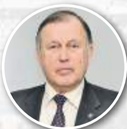
Евгений СОКОЛ , ректор Национального технического университета «Харьковский политехнический институт», профессор; школа пос. Кочеток, выпуск 1969 г.

Шановні випускники! У вас насправді починається новий етап, етап дорослішання. Більшість з вас напевне відчує себе більш вільними у виборі будь-чого. Не забути себе у цьому виборі — найголовніше. Життя пропонуватиме вам багато чого. Я вам бажаю завжди прислухатися до свого серця й залишатися самими собою.