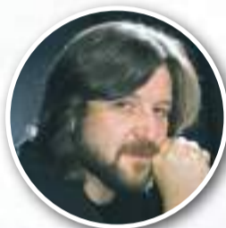
Степан ПАСЕЧНИК , главный режиссер Харьковского государственного академического украинского драматического театра им. Т. Г. Шевченко, заслуженный деятель искусств Украины; школа № 6, выпуск 1981 г.

Дорогие выпускники! Желаю вам ценить счастливое время своей юности, когда вся жизнь впереди и все по плечу. Из своего личного опыта знаю, что в жизни бывают моменты, когда все сложно, когда встречаешься лицом к лицу с неожиданными жесткими жизненными ситуациями. Но именно в момент, когда преодолеваешь трудности, ты получаешь возможность создавать самого себя. Не пасуйте перед трудностями. Они наши учителя. Не позволяйте ни одному дню своей жизни проходить без радости. Пусть даже очень маленькой радости, пусть даже никому, кроме вас, не заметной, пусть даже очень быстро проходящей. Будьте смелыми. Не бойтесь делать выбор и принимать решения. Благоприятные возможности для жизненного успеха приходят к тем, кто идет вперед и не изменяет своей мечте. У счастливых и смелых всегда все получается!